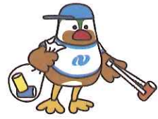
2014 長崎県庁 大会キトラクター がんばくん(長崎県)